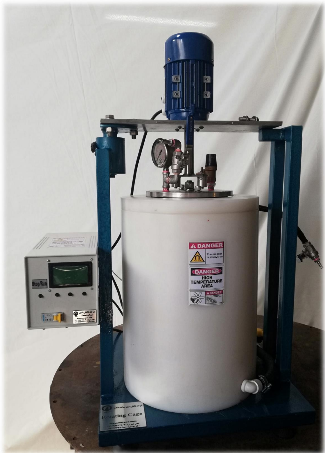
شکل ۱. تصویر دستگاه