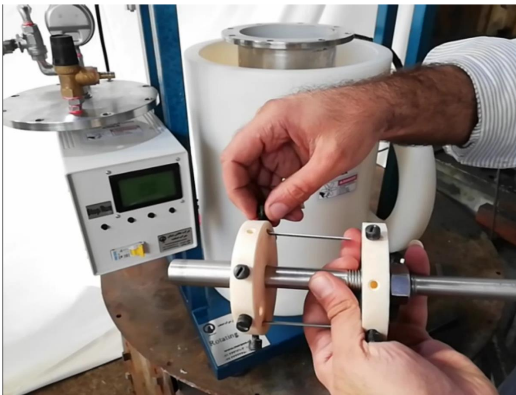
شکل ۲. شافت و هولدر نمونه های تست