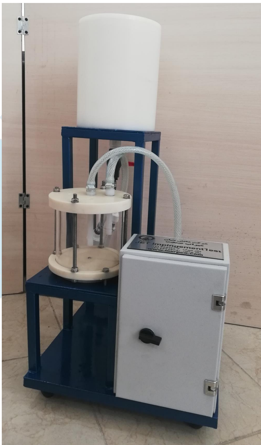
شکل ۱. تصویر دستگاه پاشش جت