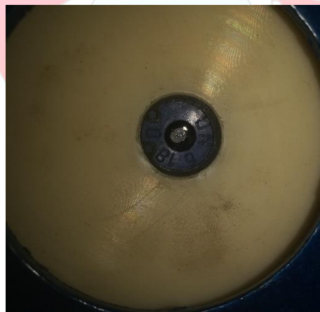
شکل ۳. پشت کپ پایین دستگاه و پکینگ دستگاه